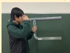
発泡スチロール砲