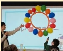
メルヘンフラワー

～東京大学サイエンスコミュニケーションサークルCAST～ 10:30～ / 13:00～ 対象:幼児、小学生 定員:40名 空気って身の回りにはあるけれど、実は知らないことばかり 楽しくて不思議な実験で、空気の力を体感しよう! 【実験内容】巨大空気砲/メルヘンフラワー/発泡スチロール砲/ マグナスコップ ほか